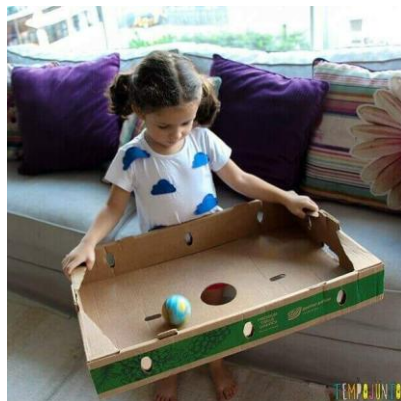
IMAGEM RELACIONADA A ATIVIDADE.